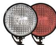
фары на СИМ